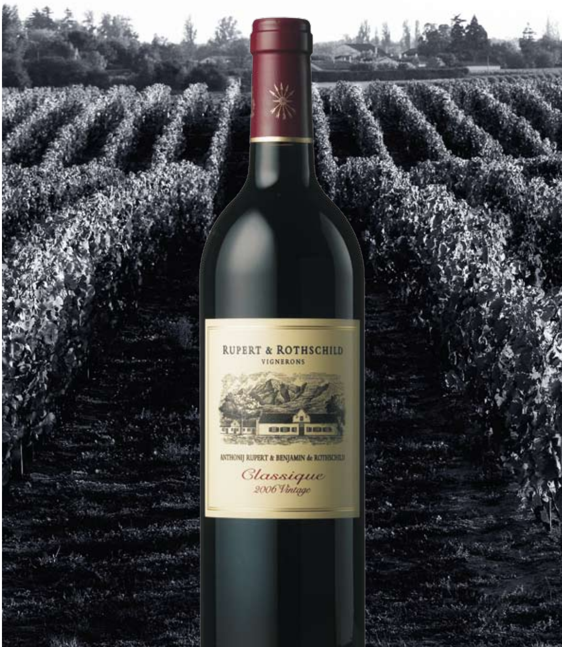
Die Kunst des Weines