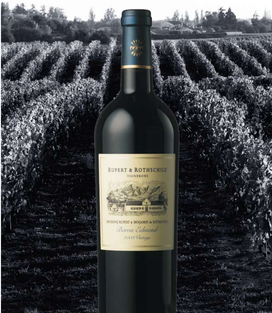
Die Kunst des Weines