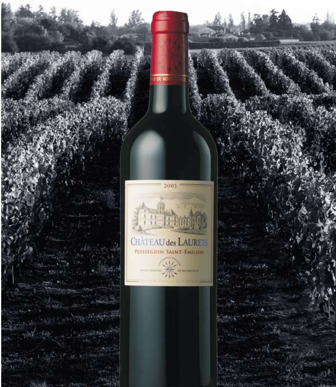
Die Kunst des Weines