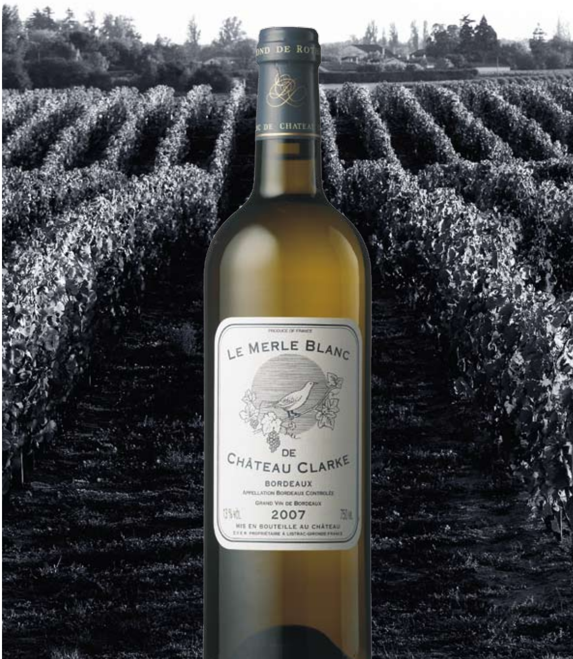
Die Kunst des Weines