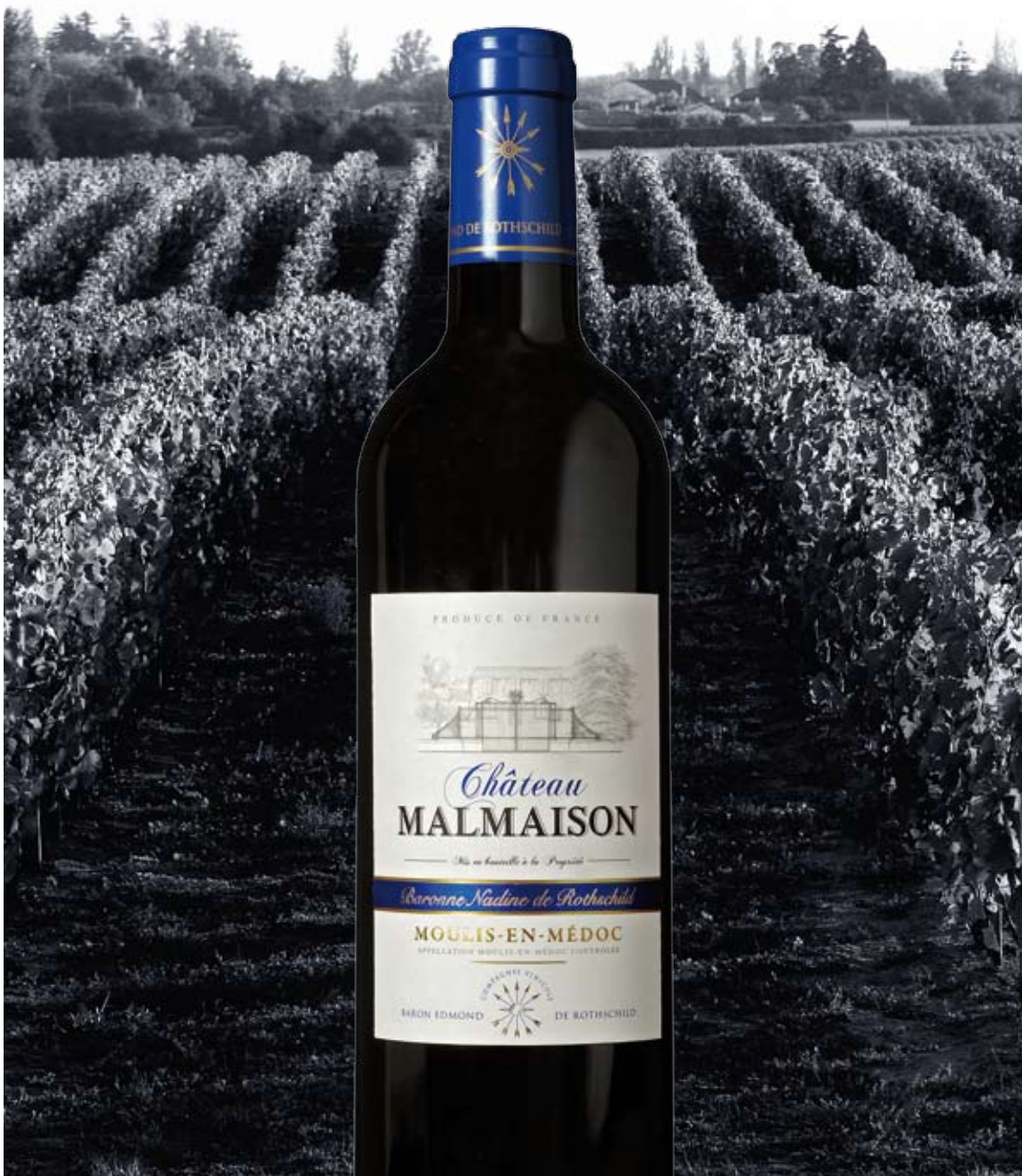
Die Kunst des Weines