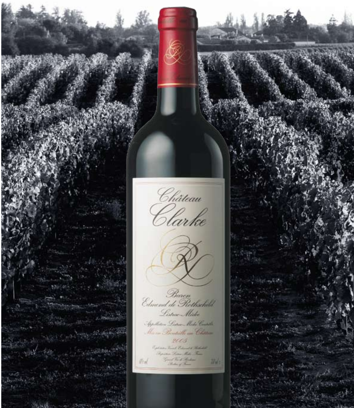
Die Kunst des Weines