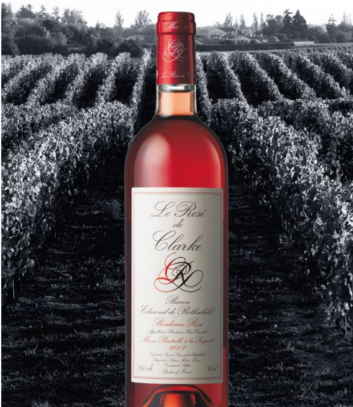
Die Kunst des Weines