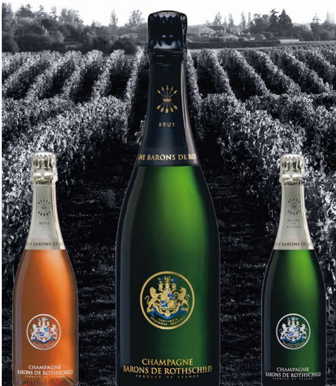
Die Kunst des Weines