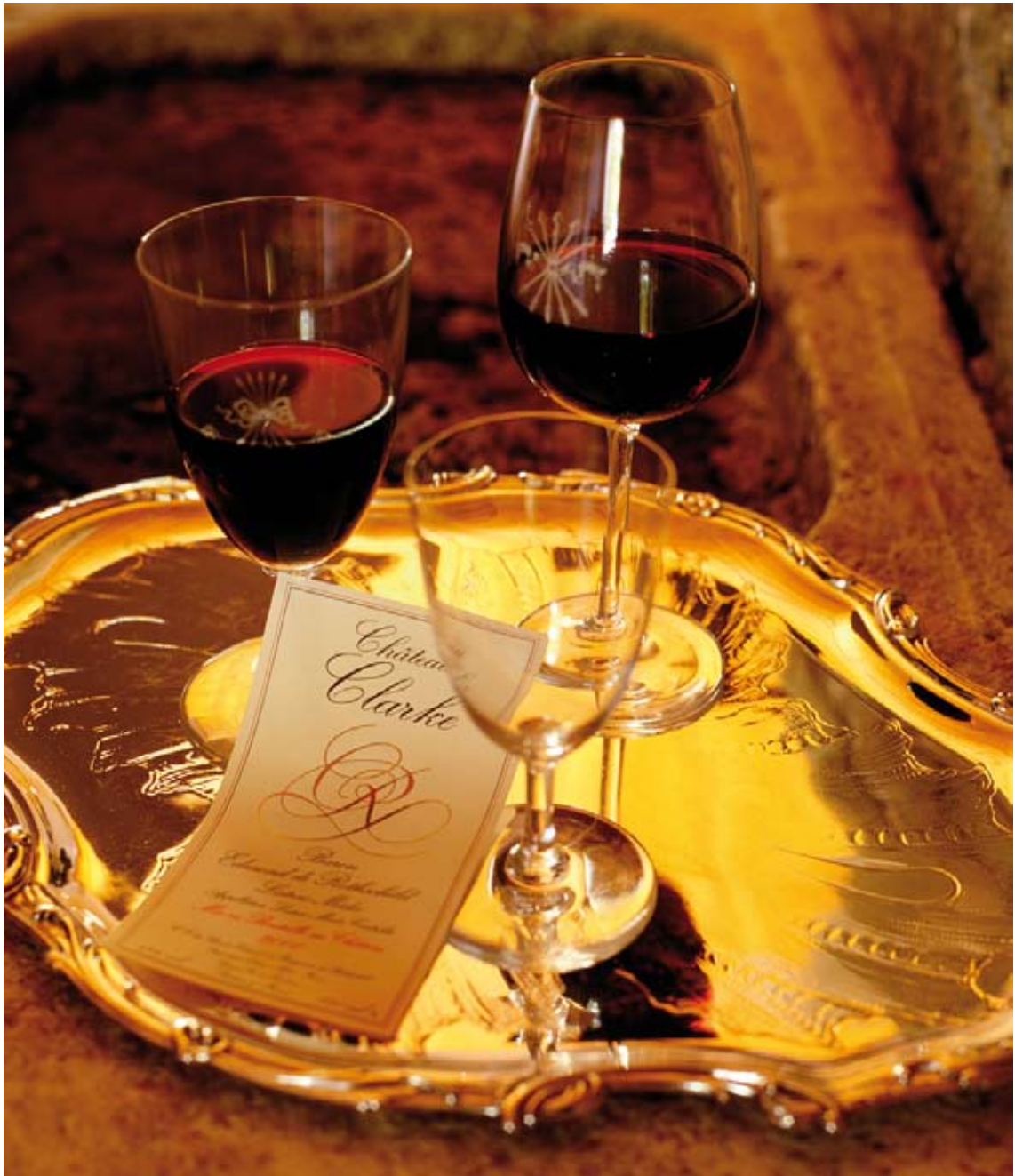
Die Kunst des Weines